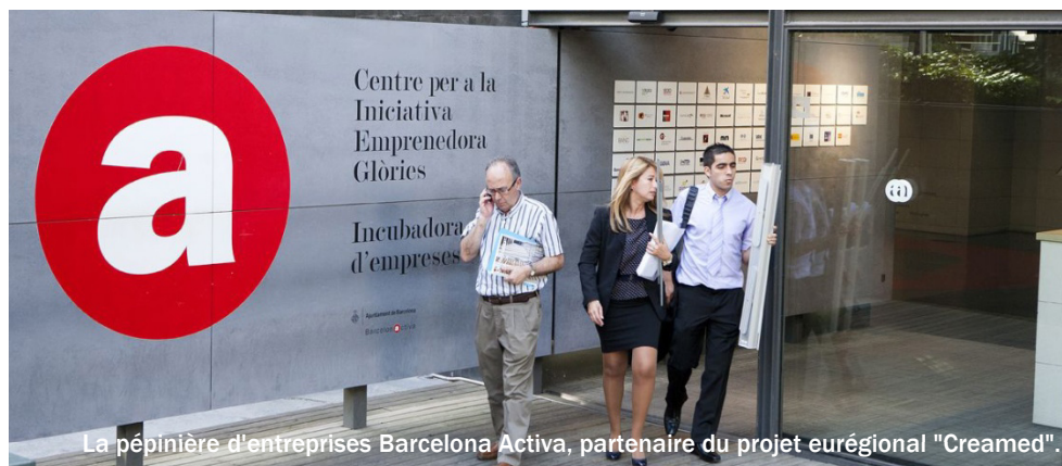
La pépinière d'entreprises Barcelona Activa, partenaire du projet eurégional "Creamed".

Plus de 95 % des sociétés de l'Union européenne sont des petites et moyennes entreprises (PME) et représentent environ deux tiers des emplois et du PIB. L'Eurorégion Pyrénées-Méditerranée, qui rassemble les régions Midi-Pyrénées et Languedoc-Roussillon en France, la Catalogne, l'Aragon et les Îles Baléares en Espagne, développe sur son territoire deux grands projets européens pour stimuler l'emploi et lutter contre la crise économique. Depuis cette année, l'Eurorégion cherche de nouveaux entrepreneurs qui souhaitent réaliser des séjours de 1 à 6 mois sur son territoire ou dans d'autres pays de l'Union européenne à travers le programme "Erasmus pour Jeunes Entrepreneurs". Pour ce projet, inspiré du programme