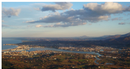
La rivière Bidassoa séparant la France et l'Espagne

Une démarche innovante a été menée au sein de l'Agglomération Sud Pays Basque, le 8 février dernier, lors d'un séminaire interne qui a