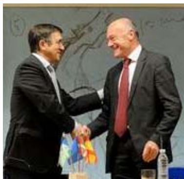
Patxi Lopez, chef du gouvernement basque et Alain Rousset, président de la Région Aquitaine, le 12 décembre 2011.

L'Eurorégion Aquitaine-Euskadi a été officiellement lancée le 12 décembre à Vitoria en Espagne avec la signature de la convention de coopération "Aquitaine-Euskadi" et des statuts portant création d'un Groupement Européen de Coopération Territoriale (GECT).