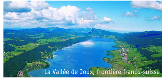
La Vallée de Joux, frontière franco-suisse

Les territoires de montagne, du fait de leur spécificité, bénéficient de politiques publiques dédiées. En quoi la problématique transfrontalière y revêt-elle une complexité supplémentaire ?