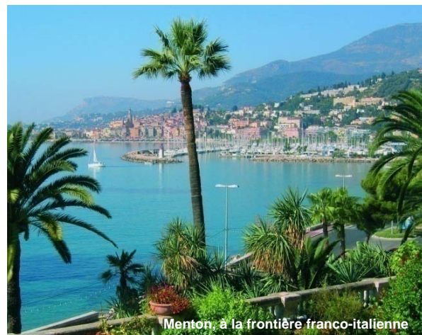
Menton, à la frontière franco-italienne

Afin d'asseoir l'Eurorégion sur des bases juridiques solides, les cinq Régions se sont engagées à élaborer un Groupement européen de coopération territoriale (GECT). Dans ce cadre, la Mission Opérationnelle Transfrontalière a apporté un appui juridique et technique à la constitution de ce GECT, dans le cadre d'une étude lancée sous la présidence de la Région PACA en juin 2008.