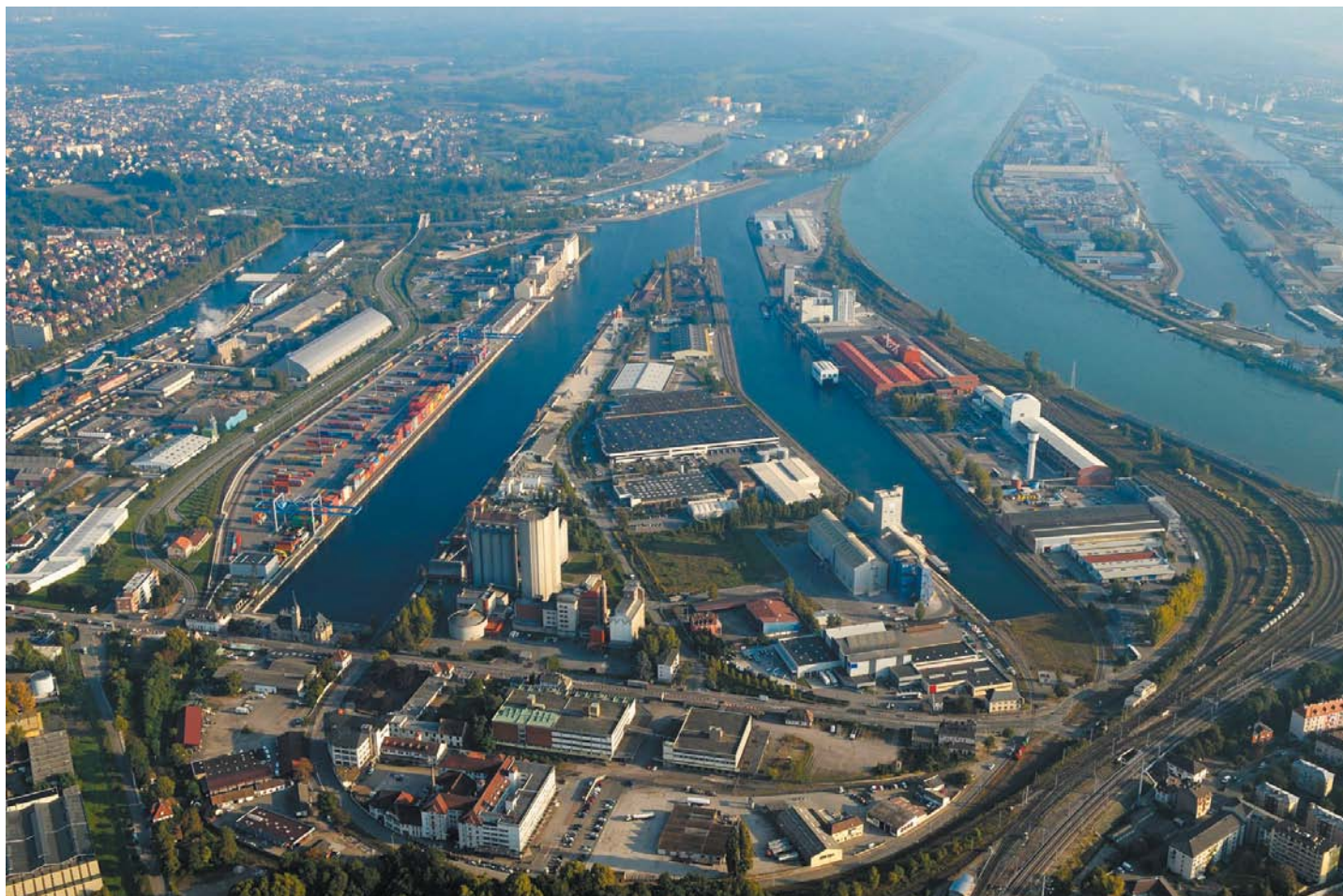
Zone portuaire Nord, Port du Rhin, Strasbourg-Kehl

Contrairement aux GPEC classiques menées par les entreprises, cette GPEC est territoriale et intègre donc les enjeux croisés existants entre entreprises et branches professionnelles (ressources humaines), salariés (parcours professionnels) et territoires (mutations économiques). De ce fait, elle relève d'une démarche partenariale conduite par les acteurs économiques et de l'emploi du territoire: collectivités territoriales, chambres consulaires, partenaires sociaux, entreprises, services publics de l'emploi, organismes de formation, etc. Mais elle est également transfrontalière, ce qui témoigne de l'émergence d'une problématique économique commune aux deux rives du Rhin et de la prise en compte de l'intégration du tissu économique et du bassin d'emploi de l'Eurodistrict Strasbourg-Ortenau dans la présente démarche.