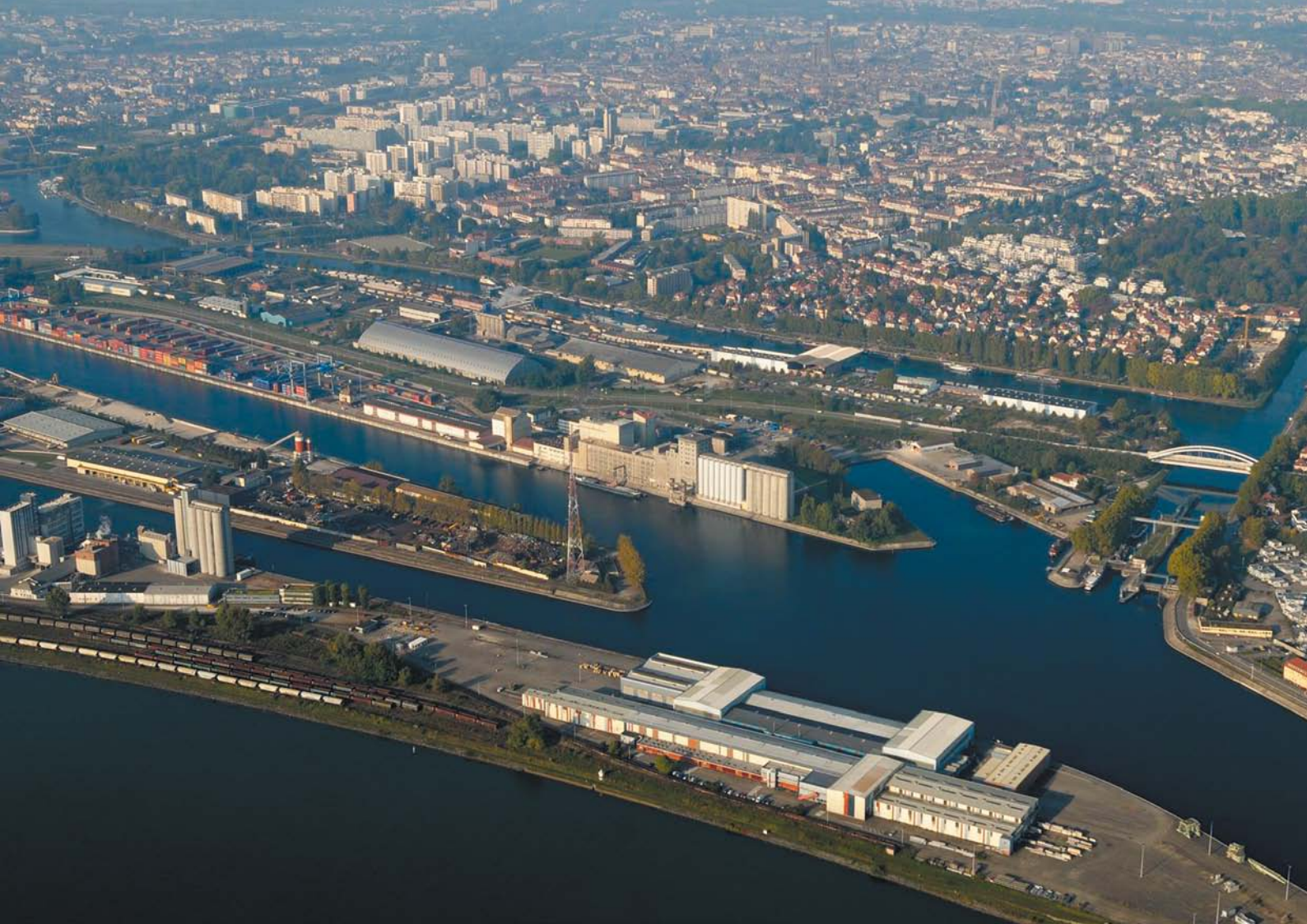
Le Rhin, zone portuaire Nord (Port du Rhin) et Strasbourg en arrière-plan