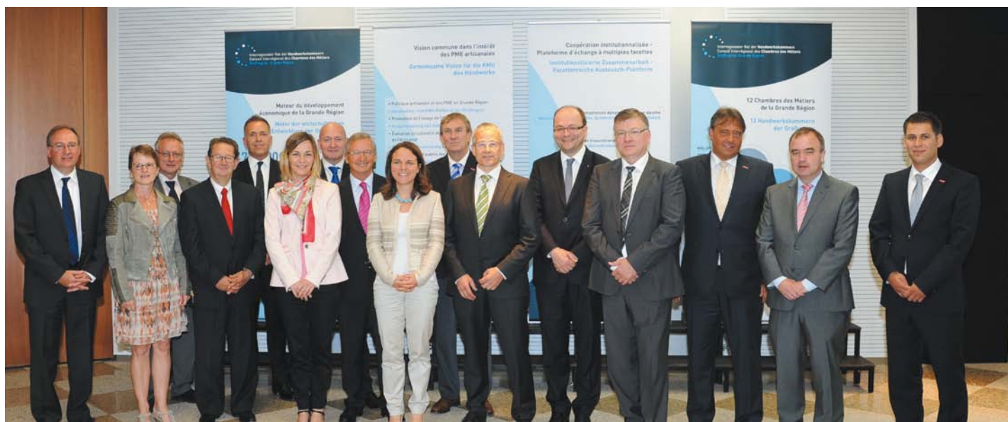
Assemblée générale du CICM en juin 2014