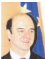
Pierre Moscovici, ministre délégué chargé des Affaires européennes.

La coopération décentralisée transfrontalière s'est développée d'une manière significative ces dernières années. Nos collectivités territoriales ont été parmi les premières à lancer des initiatives dans tous les domaines, pour mieux connaître leurs voisines européennes et commencer à réaliser des projets en commun.