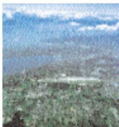
Vue aérienne du site de l'aéroport international de Genève.

Après trois ans de réflexions sur l'aménagement des abords de l'aéroport international de Genève – visant à un rééquilibrage et à un développement transfrontalier du pôle d'activité tertiaire de la zone contiguë à l'aéroport côté suisse –, les partenaires français et suisses sont entrés dans une phase de préparation opérationnelle du projet, dont les conclusions sont attendues pour la fin de cette année. Si la volonté politique est forte de part et d'autre de la frontière, encore faut-il la décliner, la préciser et la traduire