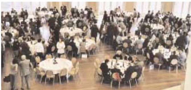
Une ambiance conviviale.