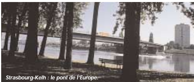
Strasbourg-Kehl : le pont de l'Europe.

d'une structure commune de codécision, seul moyen de porter un projet véritablement transfrontalier. Même si certains instruments juridiques existent, comme le Groupement local de coopération transfrontalière créé par l'accord de Karlsruhe, la nécessité de tenir compte de la multiplicité des textes existants rend les projets transfrontaliers transrhénans difficiles. Il revient donc à la Mission d'identifier l'ensemble des possibilités opérationnelles et de proposer aux porteurs du projet les solutions les mieux adaptées. ■