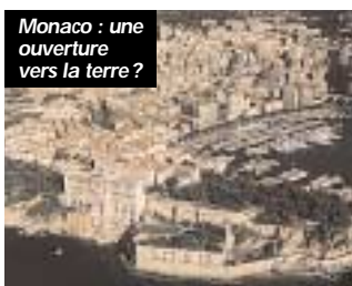
Monaco : une ouverture vers la terre ?