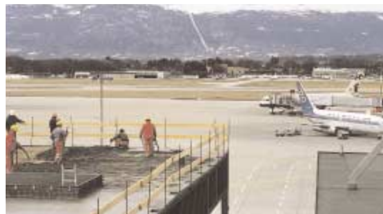
Aménagement de l'aéroparc Genève-Voltaire.

Partenaire des SEM des départements de l'Ain et de la Haute-Savoie, la direction régionale