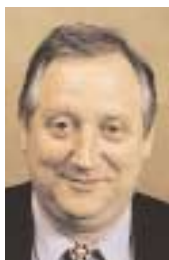
Jean-Pierre Balligand, député de l'Aisne, président de la commission de surveillance de la Caisse des dépôts et consignations.

La coopération transfrontalière, apprentissage à l'ouverture de nos territoires sur l'espace européen, mériterait au niveau national une prise en compte et un accompagnement politique, législatif, juridique, mais aussi économique moins discret. Le Conseil européen de Berlin des 24 et 25 mars 1999 a décidé de conforter l'initiative communautaire consacrée à la coopération transfrontalière, transnationale et interrégionale. On peut espérer que les prochains contrats de plan Etat-région pour la période 2000-2006 feront une bonne part aux projets d'intérêt général que sont les projets transfrontaliers, creusets de partenariats d'avenir avec les acteurs socioéconomiques. La nécessité d'une bonne maîtrise et articulation des échelles change la donne du développement. Or les blocages à la coopération sont autant de blocages au développement lui-même et l'avant-gardisme inter-culturel de la coopération transfrontalière sert encore trop souvent d'alibi à l'archaïsme de nos pratiques (1) .