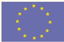
Programme d'initiative communautaire I N T E R R E G

Né du souci de supprimer les obstacles au développement que représentent les frontières nationales dans l'Union européenne, le programme Interreg entre dans sa troisième phase. Le projet devrait être définitivement adopté début 2000.