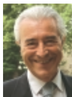
Gilles de Robien, ministre de l'Équipement, des Transports, du Logement, du Tourisme et de la Mer.

Plus de 260 000 personnes traversent chaque jour nos frontières dans les deux sens pour aller travailler.